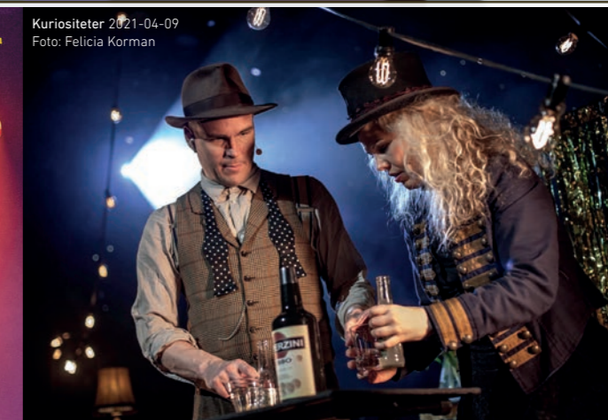
Kuriositeter 2021-04-09