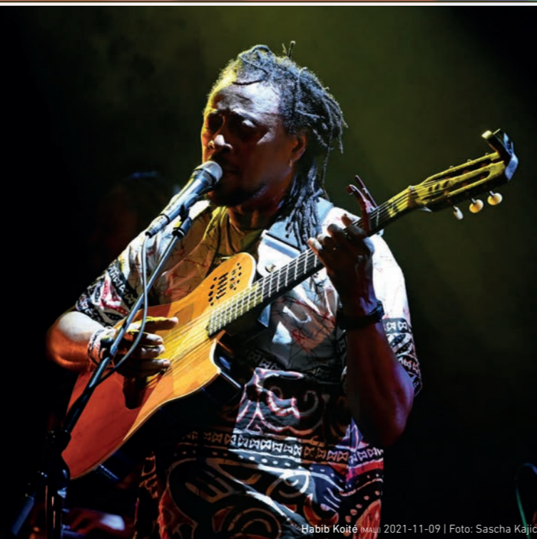
Habib Koité (Mali) 2021-11-09