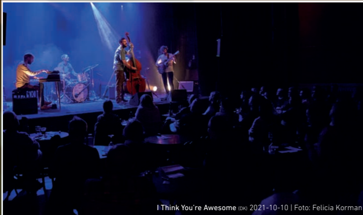
I Think You're Awesome (DK) 2021-10-10