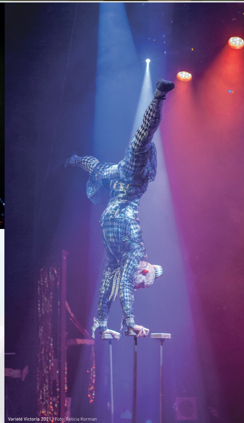
Varieté Victoria 2021