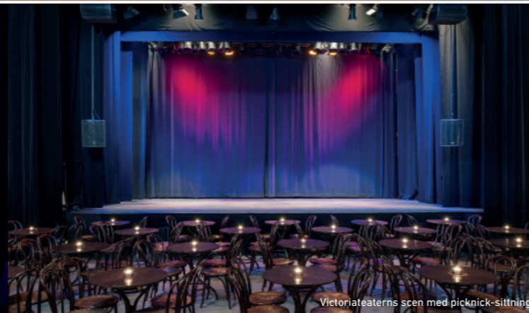
Victoriateaterns scen med picnic-sittning