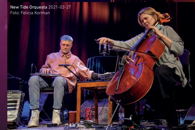
New Tide Orquesta 2021-03-27